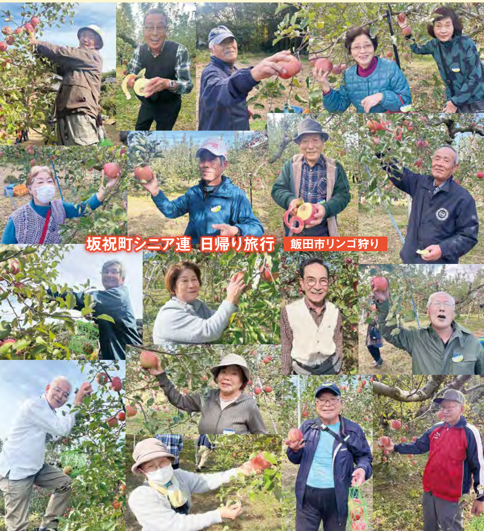
坂祝町シニア連 日帰り旅行