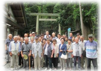
シニアクラブ会員交流日帰り旅行