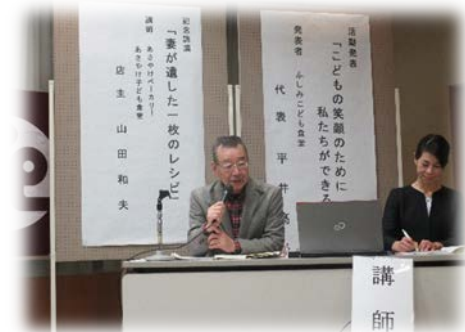
第12回坂祝町社会福祉大会