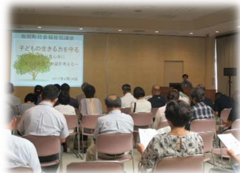
子どもの将来を考える 映画上映会&講演会