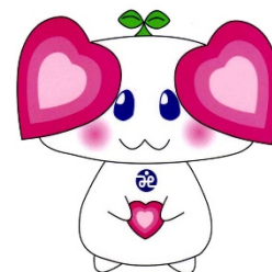
坂祝社協マスコットキャラクター