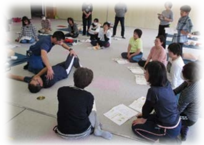
職員を対象にした普通救命講習Ⅱ

普通救命講習Ⅱ 36名 福祉車両安全運転勉強会（リフト車講習会）16名 感染予防勉強会 20名