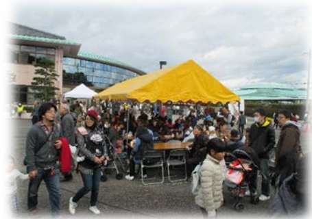
第22回福祉・健康フェスティバル