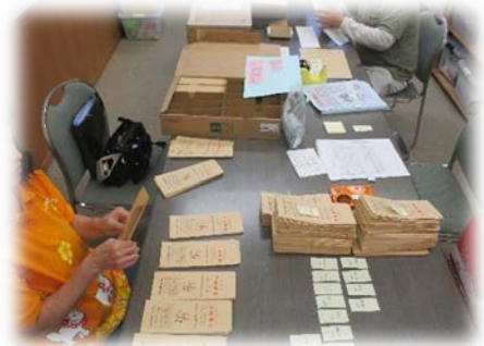
福祉的就労・ボランティア体験事業