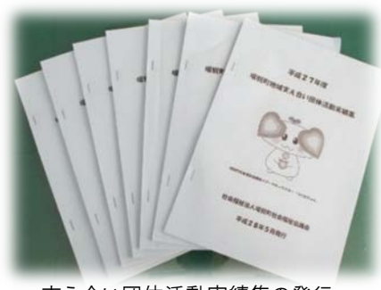
支え合い団体活動実績集の発行