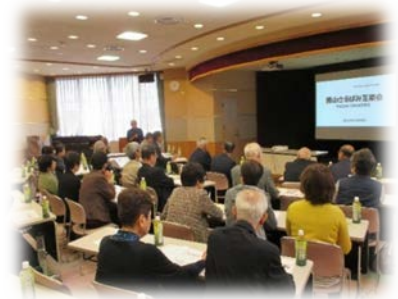
養老町社協役員研修受け入れ