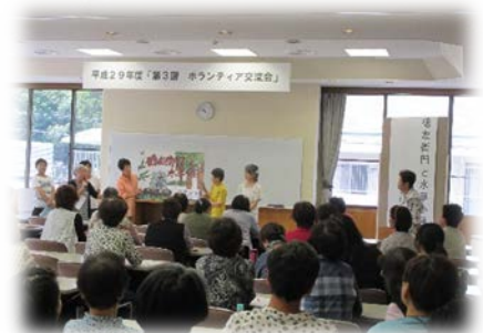
第3回ボランティア交流会