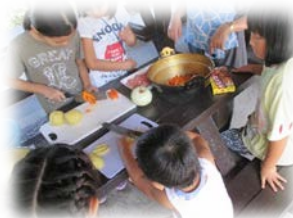
ふれあい交流事業