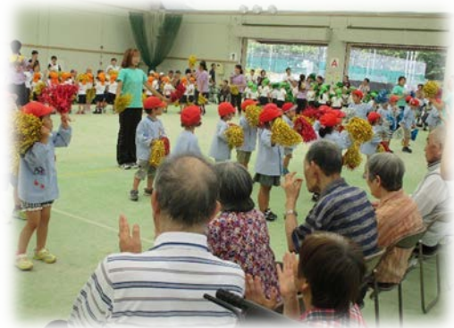
サンサンふれあい交流会