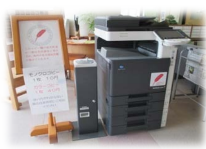
サンライフに設置してある共同募金コピー機