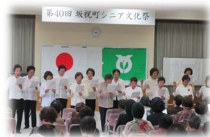
第40回シニア文化祭

シニアクラブ通信の発行（第1号：平成28年10月） クラブ内サークル「健康麻雀クラブ」の立ち上げ