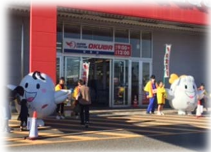
学生ボランティアによる街頭募金