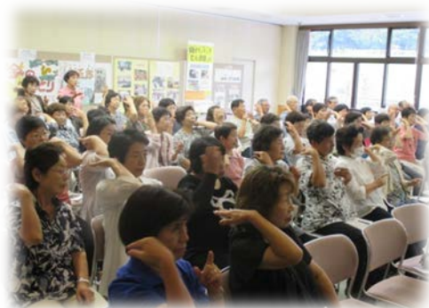
第2回ボランティア交流会「手話体験」