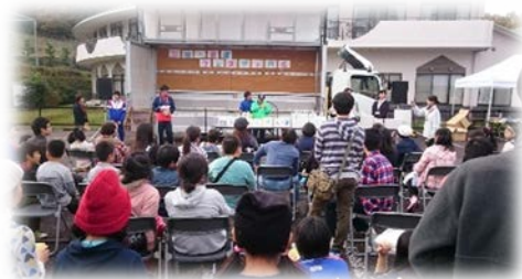
第21回福祉・健康フェスティバル「大抽選会」