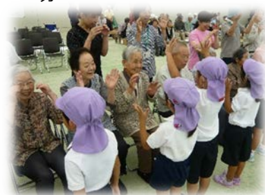
サンサンふれあい交流会「いっしょに手遊び」