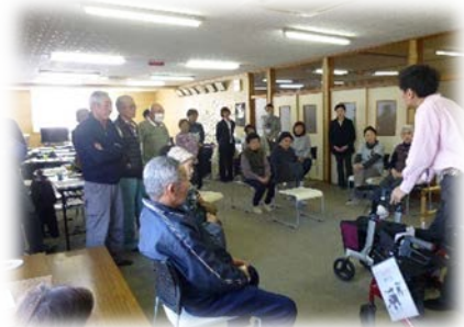
「福祉用具・住宅改修の話と実演」かもやま咲宝友隊